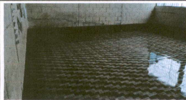
Foto3: Sustitución de piso ceramico (aula No. 3)