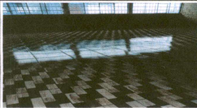
Foto1: Sustitución de piso ceramico (aula No. 1)